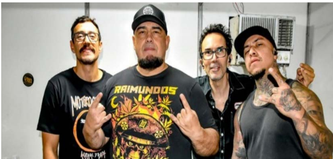
Raimundos será uma das atrações do festival gastronômico

Festival Parada Beer Fogo e Caneca une cultura cervejeira e gastronômica em Goiânia neste mês. Segunda edição acontece de 10 a 12 de novembro