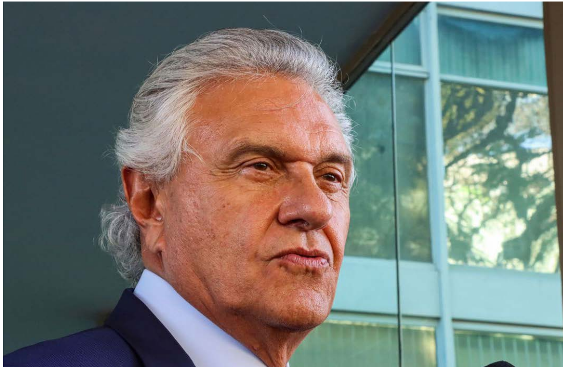
Ronaldo Caiado espera que novas mudanças sejam feitas no plenário do Senado Federal

Mais uma vez, o governador reforçou a importância de