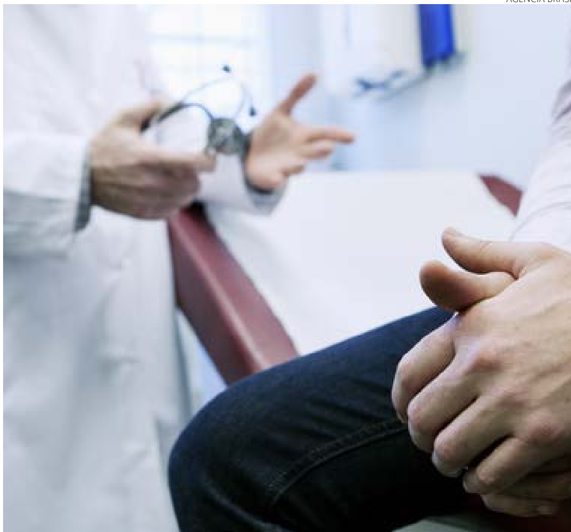
Novembro Azul desempenha papel importante ao chamar a atenção dos homens para a importância da realização de exames regulares

A campanha em tela, se torna fundamental na luta contra o câncer de próstata, ela é um lembrete para que os homens compreendam a necessidade de se envolver ativamente na busca pelo seu bem-estar. O "Novembro Azul", portanto, desempenha um papel vital na promoção da saúde dos homens, o melhor caminho sempre será o do monitoramento para prevenção!