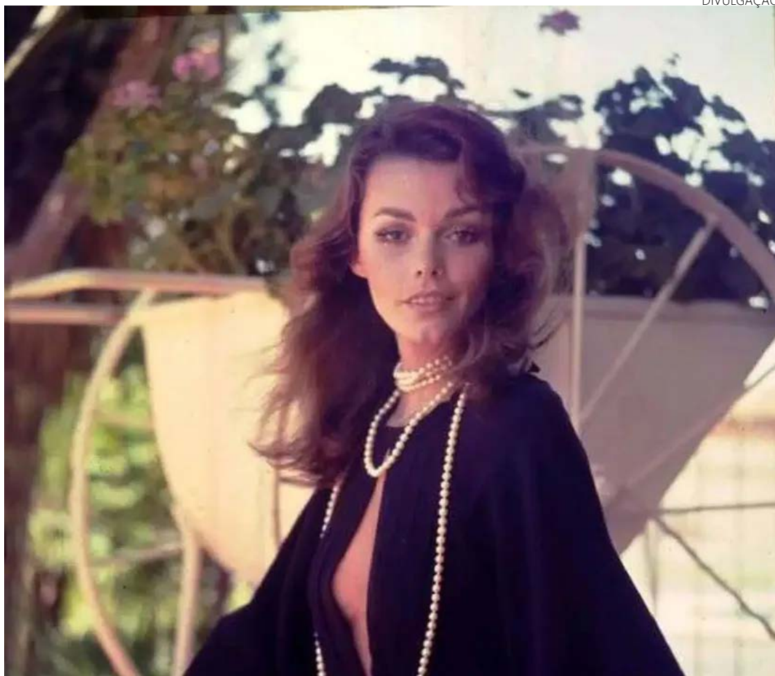
Ângela Diniz: Uma luta pela justiça que ainda não acabou

Ângela Maria Diniz, um nome que ecoa na história do Brasil, não apenas por sua tragédia pessoal, mas pelo impacto que teve na luta pelos direitos das mulheres. Ângela foi vítima de um feminicídio brutal em 30 de dezembro de 1976, quando seu então namorado, Doca Street, disparou três tiros em seu rosto e um na nuca, tirando-lhe a vida aos 32 anos, em Búzios, Rio de Janeiro, deixando para trás três filhos.