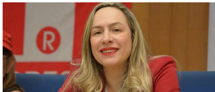
Adriana Accorsi: primeiros passos na pré-campanha