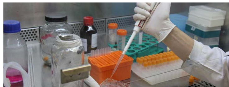
Estimava-se que mais de 3,8 milhões de pessoas sofriam de alguma forma grave da doença

Análise detalhada dos causadores das micoses esporotricose e histoplasmose agrega dados importantes para a elaboração de medicamentos e possível vacina que abranja vários fungos