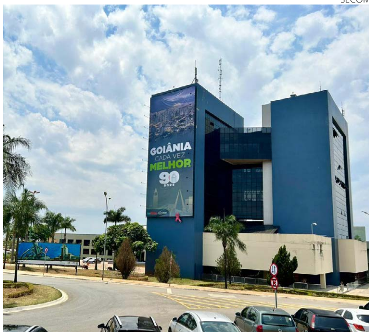
Prefeitura de Goiânia: Integralização do capital social é prevista desde a criação da companhia em 1974

tura repassará para a Comurg terá origem no cancelamento de outras dotações orçamentárias que não são prioridades para este ano. Vale lembrar que, além de ser uma obrigação da Prefeitura, a integralização do capital social também é importante para dar à empresa uma musculatura financeira maior, possibilitando que a Comurg atenda o contrato com o Paço Municipal com mais qualidade e rapidez.